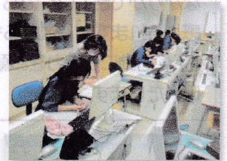
放課後学習会の様子。学習サポーターによる支援。

夏休みまで1ヶ月を切り、7月は管内中体連や2年宿泊研修があり、暑さも予想されます。学校でも、生徒会スローガン「挑戦～おそれるな」の下、将来にわたって必要な資質能力の育成に向けて取り組んでまいります。