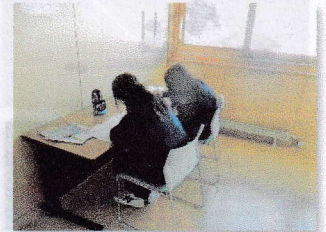
フリースペースで学習する生徒