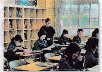
支援員によるサポート